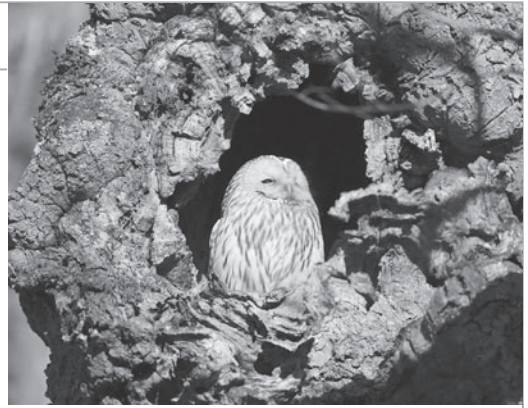
北海道鶴居村にて

2013年10月、実務修習地が決まった。実家は神奈川県川崎市のため、できれば実家から通える庁であってほしかった。