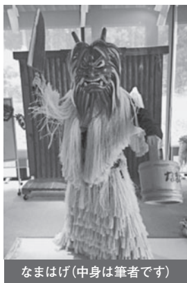
なまはげ(中身は筆者です)

こうした中で最近、様々な職種の福祉関係者が集って横断的なネットワークを作り、秋田の福祉を変えていこうという動きがあります。その中心メンバーの方と事件処理で連携していたことから、私たちスタッフ弁護士もその集いに参加しました。こうした交流を通じて、福祉関係者の弁護士に対する心理的ハードルが徐々に低くなり、弁護士に相談する機会が増えてきていると思います。今後、秋田ならではの司法ソーシャルワークの枠組みが築かれればと思っております。