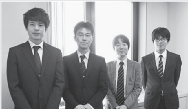
法テラス秋田法律事務所のメンバー。左から2人目が筆者