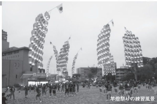
竿燈祭りの練習風景

があります。私も何度か、山歩きの企画に参加しました。静かなブナ林を歩き、山頂からの展望を満喫し、麓の秘湯で汗を流し、街に帰ったらいきつけの居酒屋で生ビール。至福のひとつときです。晴れた休日は、河口から砂浜に出て、潮騒を聞きながら波打ち際を1人散歩するのもいいリフレッシュになります。週末は、事務所の近くの健康ランドで温泉に浸かり、サウナで汗を流しています。秋田に来て、日本酒と温泉に目覚めました。