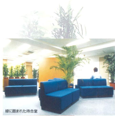
緑に囲まれた待合室