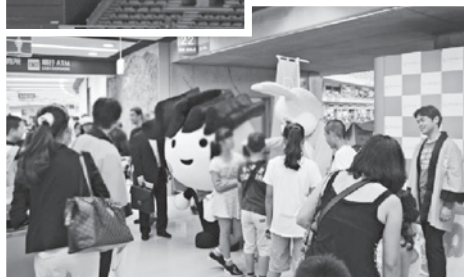
ブースを訪れる来場者を出迎える ジャフバくん達