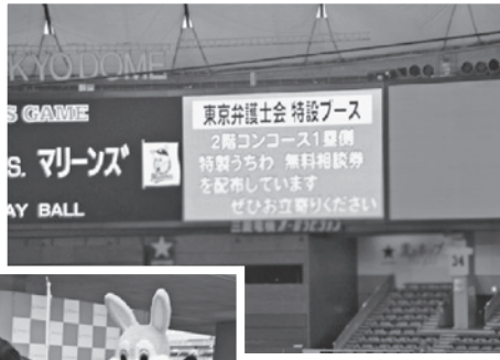
大型スクリーンに流れる 東弁の動画