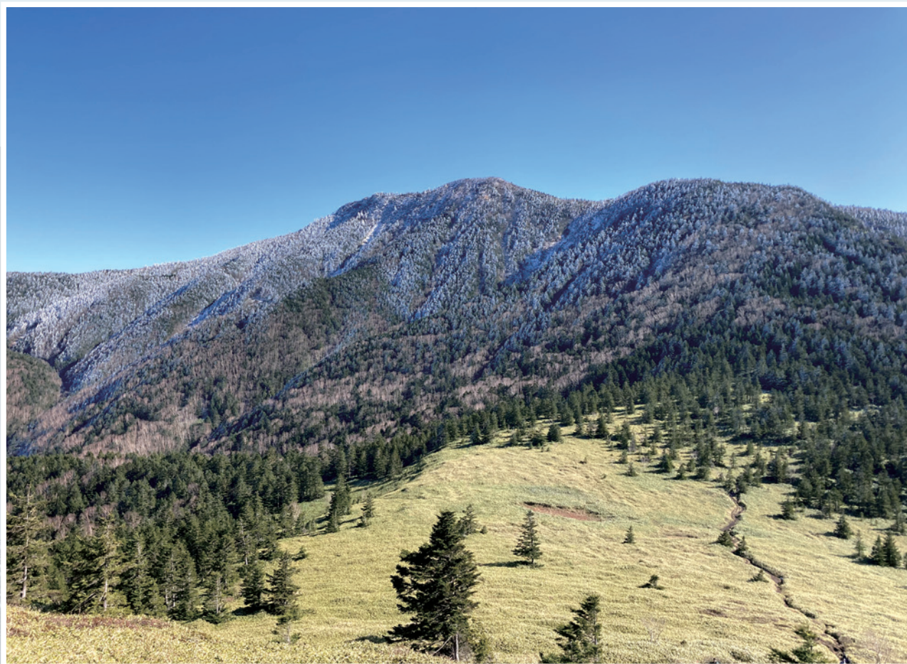
四阿山 (あずまやさん) / 標高 2354m