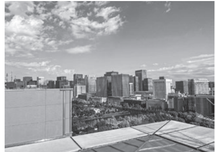
弁護士会館屋上ヘリポートからの眺望

毛布などの備蓄や普段は立ち入ることのできない屋上ヘリポート等の見学などを行い、普段何気なく