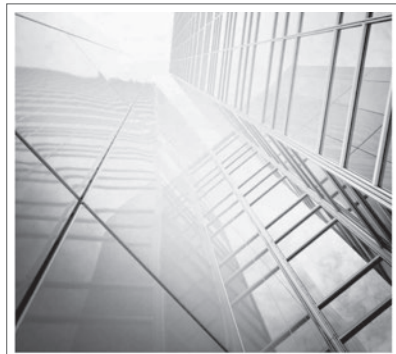
東京で独立開業する。 ～独立開業マニュアル東弁版～ 第3版

少しでも当部会に興味を抱かれた会員がいれば、ぜひ見学からでもお越しいただきたい。