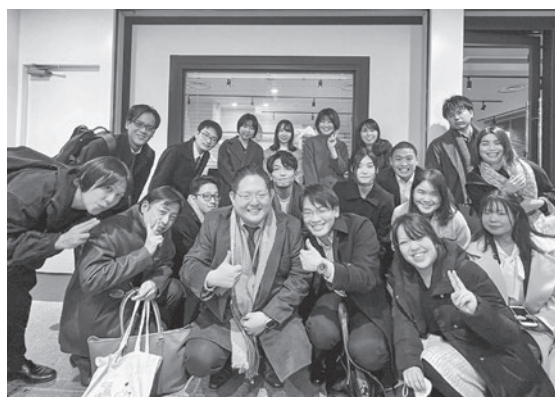
新入会員歓迎会を終えて

以上のとおり、当委員会は、新入会員歓迎会により新入会員の当会への帰属意識を高めるとともに、新進会員と理事者との懇談会等により新進会員の意見を当会の理事者に届けることで、新進会員の意見を当会の運営へ反映させていくという、重要な職務を担っている。このような職務を全うできるよう、今後も積極的に当委員会の活動に取り組んでいきたい。